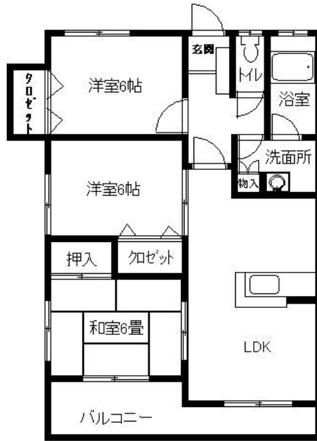
2・3号タイプ (1号は反転タイプ)